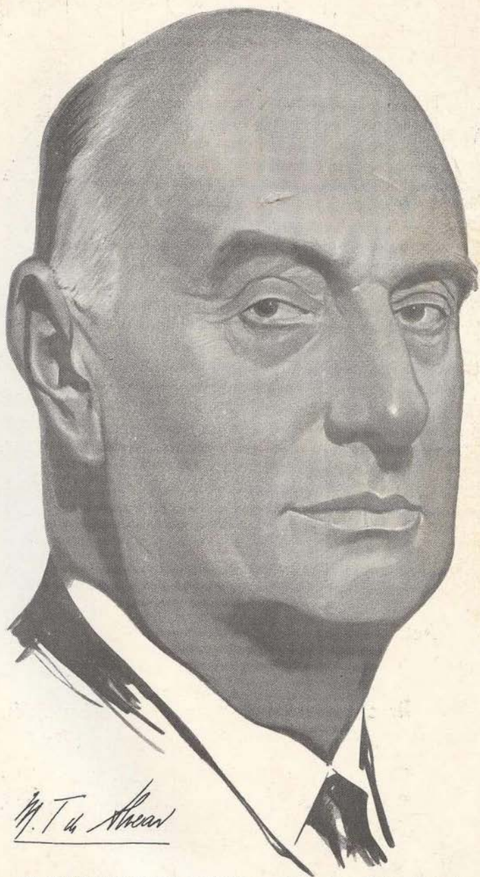
DR. MARCELO T. DE ALVEAR, candidato de la Unión Cívica Radical a la presidencia de la República.